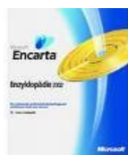
10. CD Rom