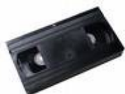
6. Cassette vidéo