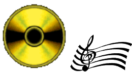
9. CD audio