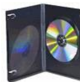
11. DVD Rom